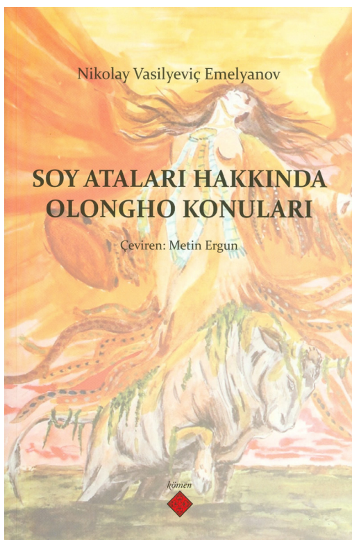
Рис. 2. Издание перевода на турецкий язык монографии Н. В. Емельянова «Сюжеты олонхо о родоначальниках племени», 2016 г.

В целом же издание переводов трудов наших олонхovedов на иностранных языках представляет большой интерес. Подобные переводы дают возможность фольклористам, ученым-исследователям, интересующимся эпосами народов мира, ознакомиться и пользоваться ими на родном языке и, надеемся, способствуют дальнейшим исследованиям по якутскому эпосу. Профессор Метин Эргюн положил хорошее начало и его инициатива, думается, найдет поддержку, особенно со стороны англоязычных авторов.